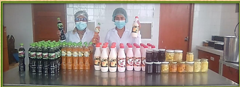
Certificación: Asistente de procesamiento de frutas y aceitunas